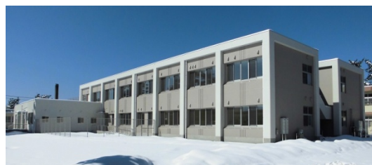
<重症心身障害病棟 外観>

また、契約の際に日中活動の様子等を確認さ せていただくため、「利用者登録カード」の用 紙をご記入頂きます。